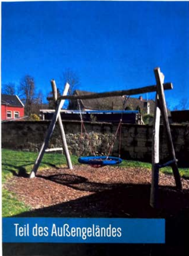
Teil des Außengeländes